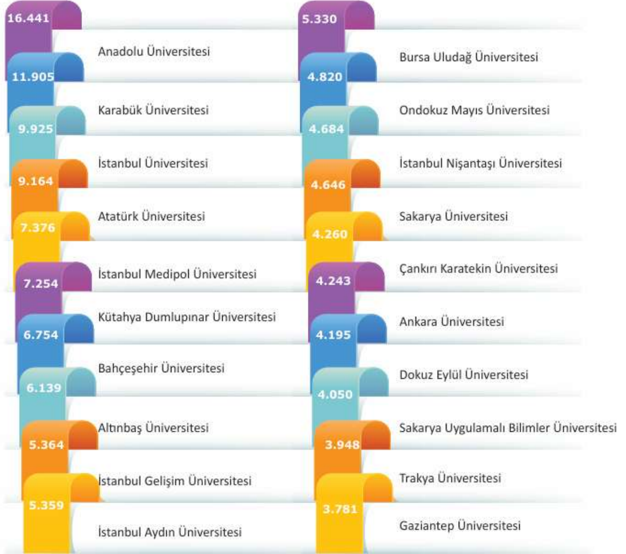
Őekil 1. Uluslararası öęrenci sayısının en yüksek olduęu üniversiteler